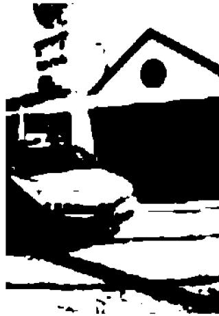
La questura a Santa Chiara

«Rivoluzione» a partire dal prossimo 20 maggio. Il documento costerà 45,62 euro