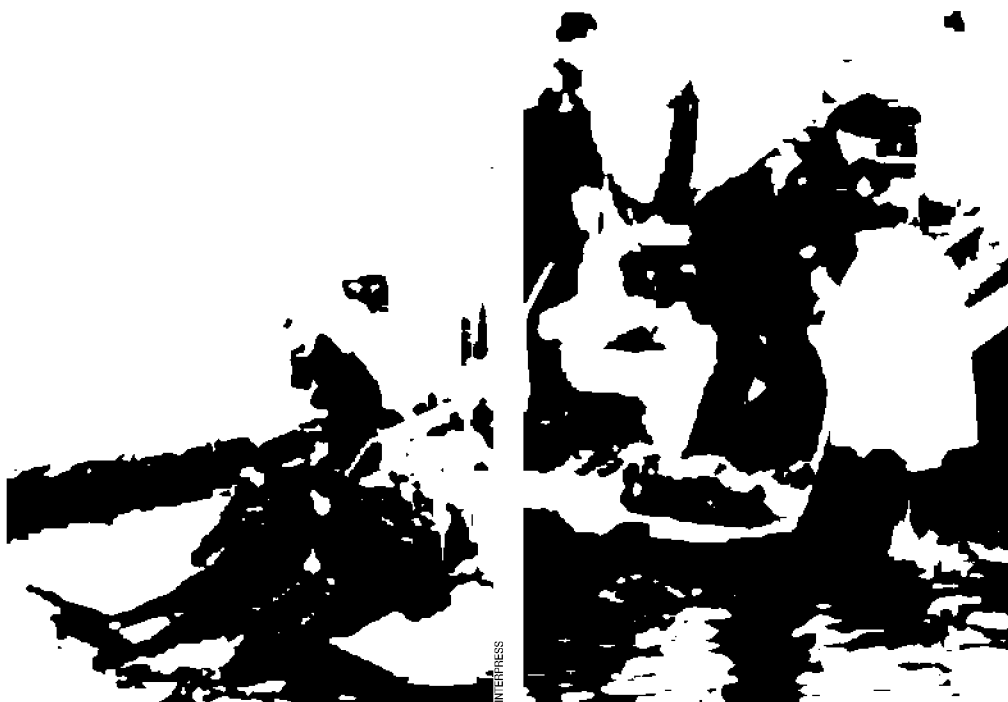
Una delle imbarcazioni utilizzate dalla questura

Nuove volanti lagunari? Un miraggio per la polizia veneziana. Bocciato anche il prototipo della ditta che aveva vinto, tre anni fa, la gara per la fornitura di diciassette nuove imbarcazioni da destinare al centro storico, si deve ricominciare tutto da capo. E i poliziotti di Santa Chiara, per avere nuove barche, dovranno aspettare almeno altri due anni e mezzo.