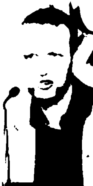
Flavio Tosi, sindaco di Verona. Auspica una profonda riforma dei vigili urbani per garantire maggiore sicurezza ai cittadini

il servizio ai cittadini e riconoscere agli agenti locali le nuove incombenze e responsabilità in tema di sicurezza e per le quali servono professionalità ed impegno».